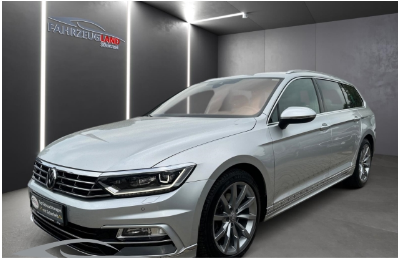
FAHRZEUGLAND Südwest www.fahrzeugland.com Tel.: 07631 - 974740